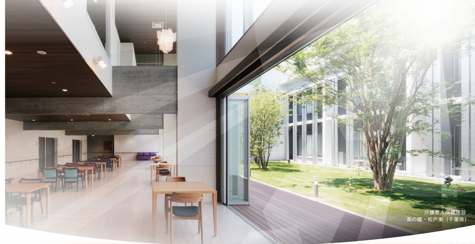
介護老人保健施設 葉の園・松戸東（千葉県）