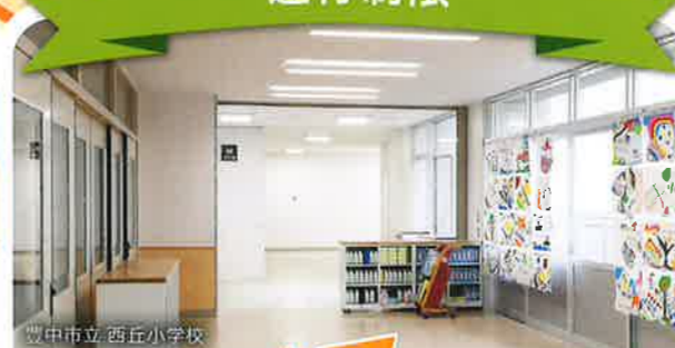
豊中市立西丘小学校