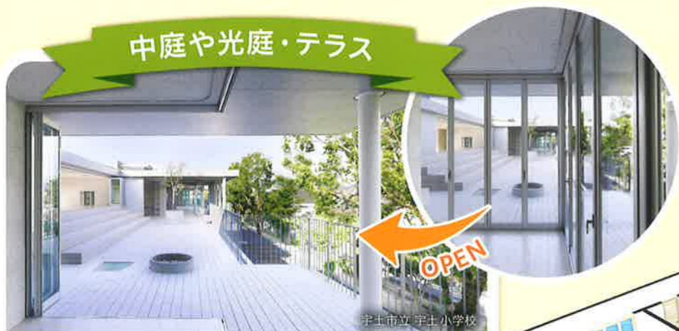
中庭や光庭・テラス

イスターカーテンが提供する可変空間は、これからの時代に向けた、自由な学習環境を実現します。